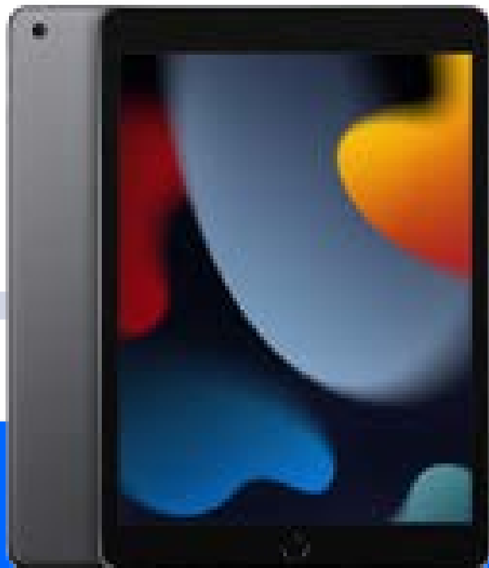
iPad Air. Superpotenciado con el chip M1